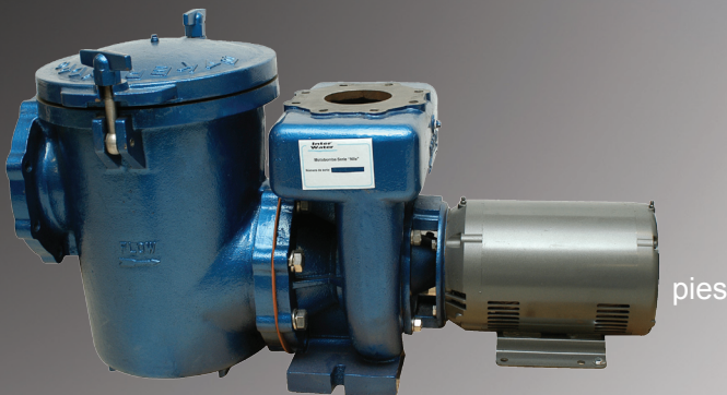
Motobomba Serie "Nile"